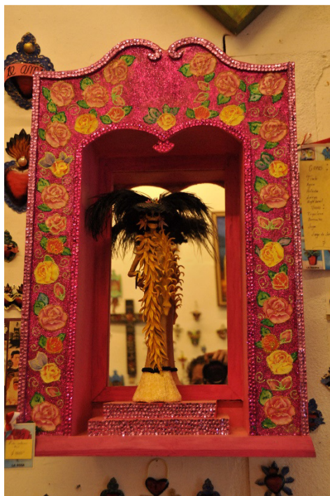
Figura 11. La Catrina. Figura 12. Calaveras en papel picado