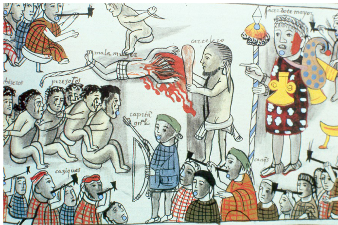
Figura 1. Relación de Michoacán Lámina II: Ejecución de malhechores en la fiesta de Ecuata-Conscuaro. Figura 2. Relación de Michoacán Lámina XXVIII: El Cazonci, el gobernador y algunos diputados y artesanos.

Fuente: Alcalá, Fray Jerónimo de, La Relación de Michoacán , Morelia, Fímax Editores, 1980. Foto: Archivo Torres Salomao (1998).