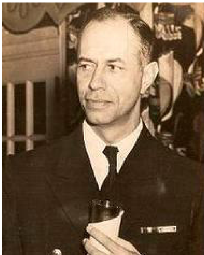
Figura 3: Belart como capitão de mar e guerra nos EUA